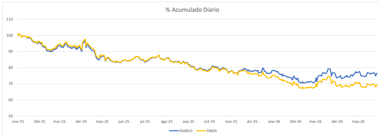
EVOLUCION DE UNA INVERSION DE $1,000.00 MXN 2